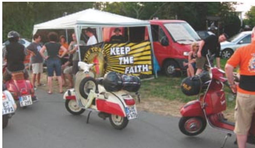
Zivile Preise, eine gute Organisation und natürlich den Sommer von seiner schönsten Seite kennzeichneten das Treffen des „The Torch S.C.“ in Ochtrup.

lichkeit ist die, dass man sich nach einer Lokalität umsieht, die einem zumindest den ganzen gastronomischen Anteil der Veranstaltung abnimmt – und daran natürlich auch verdient – und man sich ausschließlich um die anderen Aspekte eines Treffens kümmern muss. Letzte-