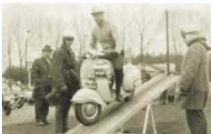
Seit Jahrzehnten ist der VC Bürgel eine feste Adresse im Vespa-Sport.

28-mal Deutsche Mannschafts-Meisterschaft im Vespa-Turnier-Sport, 13-mal