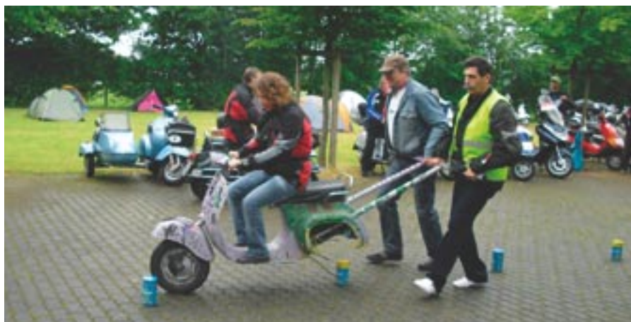
Spaß bei den Fungames: Trotz des schlechten Wetters kamen die Teilnehmer des Lippstädter Treffens voll auf ihre Kosten.