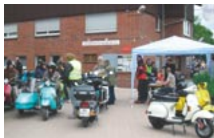
Der Sportplatz in Datteln war das Ziel des Piraten-Treffens.

Zwei Partys, Getränke zu zivilen Preisen und ein scheinbar nicht verlöschender Grill sorgten bis spät in die Nacht für eine sehr angenehme At-