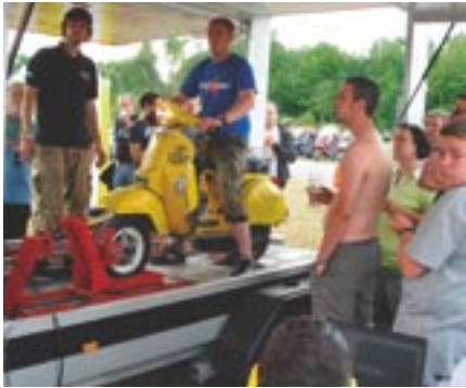
Der Prüfstand vom Scooter-Center war immer gut besucht.

Am nächsten Tag wurde nach einem leckeren Frühstück eine Menge geboten. Für die kommende Rollerfahrergeneration war eine Hüpfburg aufgebaut und auch ein „Menschenkicker“ sorgte für Unterhaltung. Lange Schlangen gab es beim Leistungsprüfstand des Scooter-Centers Köln. Viele wollten wissen wie viele Pferdestärken ihre Vespen haben. Auf einem Teilemarkt konnte man das ein oder andere erstehen. Weiterhin wurde eine touristische Ausfahrt ins Bergische angeboten, die durch schöne Nebenstrecken die Teilnehmer bis zur Schloß Burg führte. Weitere Optionen waren der Besuch des Meilenwerks oder der Düsseldorfer Kirmes. Auch die Fun-games sorgten bei strahlendem Sonnenschein für gute Unterhaltung.