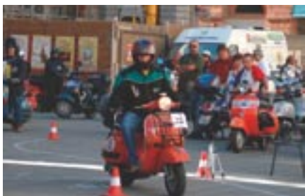
Die Vespa Raid in Italien zählt ebenfalls zur Wertung.

ter lange Strecke in einer vorher festgelegten Zeit zu fahren. Nur mit Kompass und Karte bewaffnet müssen die Teilnehmer die Route finden. „Es kommt dabei nicht auf Höchstgeschwindigkeit an“, sagt Manfred, „die Fahrer müssen Tempo und Strecke selbst richtig einschätzen.“ Unterwegs warten verschiedene Prüfungen auf die Fahrer.