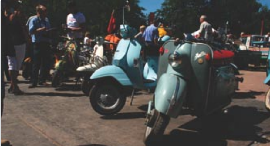
Zeitweilig tummelten sich weit über 300 Roller auf dem Museumsgelände am Kiekeberg. Bis jetzt ist Hamburg eins der erfolgreichsten Treffen 2010.

Hamburg. Hat das Spaß gemacht! War das geil! So sollten Treffen sein! 60 Jahre ist der Vespa Club Hamburg (VCH) geworden und hat kein bisschen Rost angesetzt. Das hat er mit dem Vespa-Treffen vom 4. bis 6. Juni unter Beweis gestellt. Rund 220 VCVD-Vespisten mit 130 Rollern hatten sich eingefunden, um mit den Hamburgern deren Geburtstag zu feiern. Zudem kamen noch mehrere Hundert Tagesgäste, zum Teil auf ihren motorisierten Zweirädern, die mal in die Szene hineinschnuppern und sich vor allem das riesige Rahmenprogramm nicht entgehen lassen wollten.