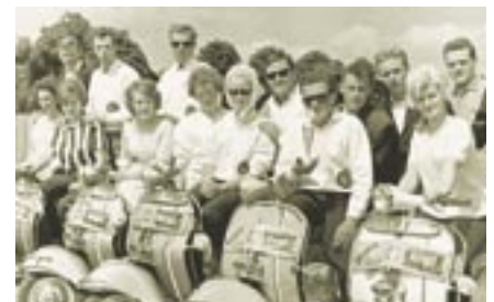
Gemeinschaft wird bei den Bürgelern damals wie heute groß geschrieben.

Gemeinschaft wird beim VC Bürgel groß geschrieben. Diese pflegen die Bürgeler nicht nur mit den Vespisten, sondern auch mit ihrem Ort. Sie veranstalten eigene Kappenabende und sind beim