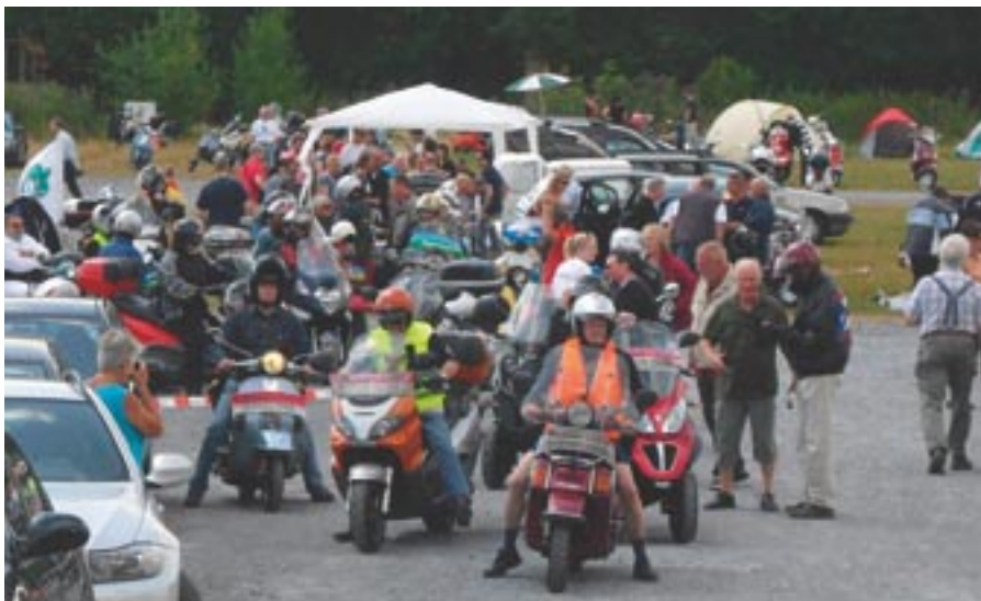
Aufstellen zur Ausfahrt: Geführt von den Lotsen des VC Düsseldorf machten sich die Teilnehmer auf die Tour durchs Bergische Land.