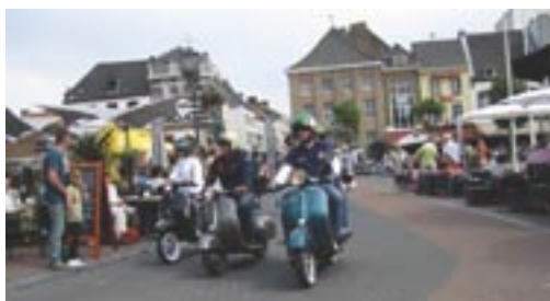
Der Corso führte die Vespafrunde quer durch das Umland und Sittard.

Die Ausfahrt am Sonntag haben wir leider ebenfalls nicht mitmachen können. Alles in allem war es ein tolles, großes Treffen. Sehr viele Teilnehmer und Besucher mit vielen Rollern, darunter auch viele ältere Fabrikate! Wir würden wieder hinfahren!